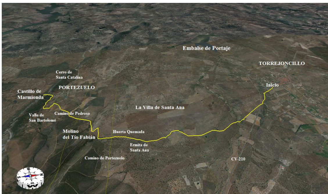
Mapa Ruta Camino de Portezuelo