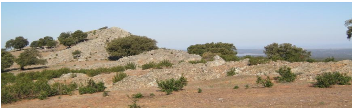
Cuarcita en las proximidades del Molino del Tío Fabián

GEOLOGÍA: Durante la ruta podemos observar gran cantidad de pizarra y suelos arcillosos muy blandos, idóneos para caminar. También podemos ver gran cantidad de cuarcita en las crestas de las sierras.