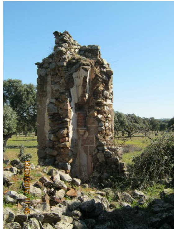
Ermita de Santa Ana

Una vez dejamos la dehesa de Santa Ana nos encontramos con el Camino de Portezuelo, a la altura de la zona denominada Huerta Quemada.