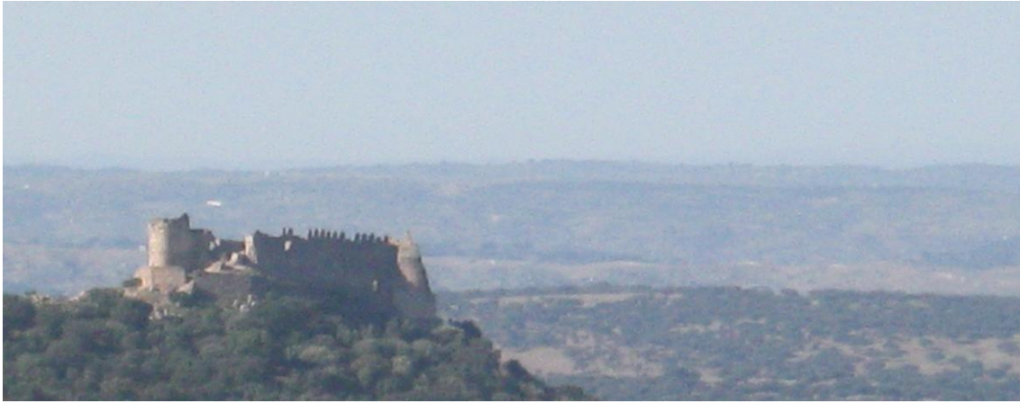
Castillo de Marmionda desde el Camino de Pedroso de Acím

Desde las proximidades de Portezuelo subimos al Castillo de Marmionda por una vereda de fuerte pendiente.