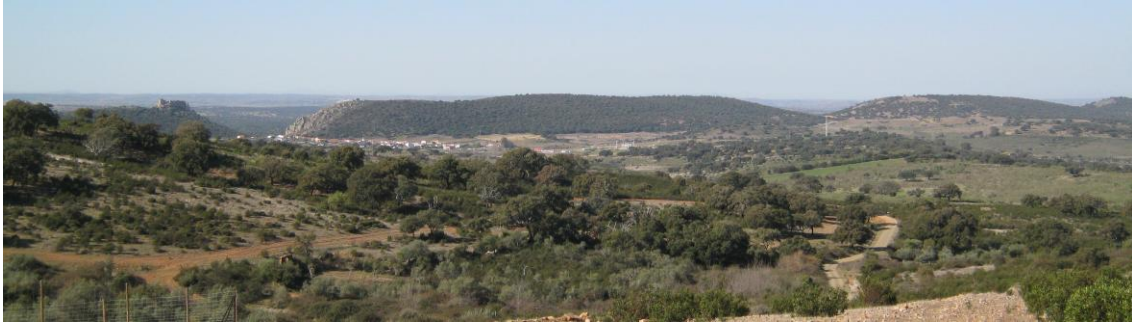
Camino de Pedroso de Acím, Portezuelo, Castillo de Marmionda y Cerro de Santa Catalina