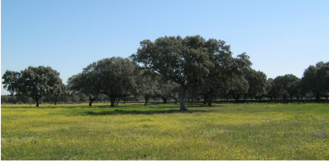
Imagen de la Dehesa