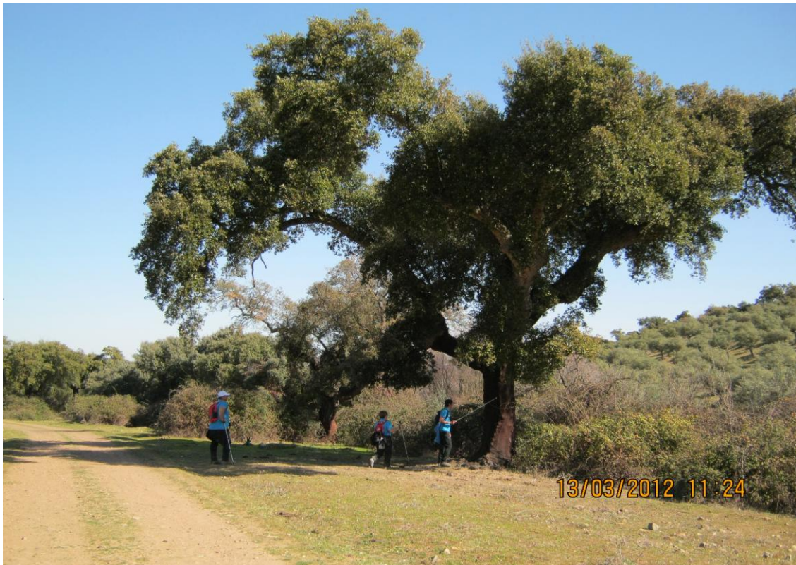
Dehesa de Santa Ana

Una vez dejamos la dehesa de Santa Ana nos encontramos con el Camino de Portezuelo, a la altura de la zona denominada Huerta Quemada.