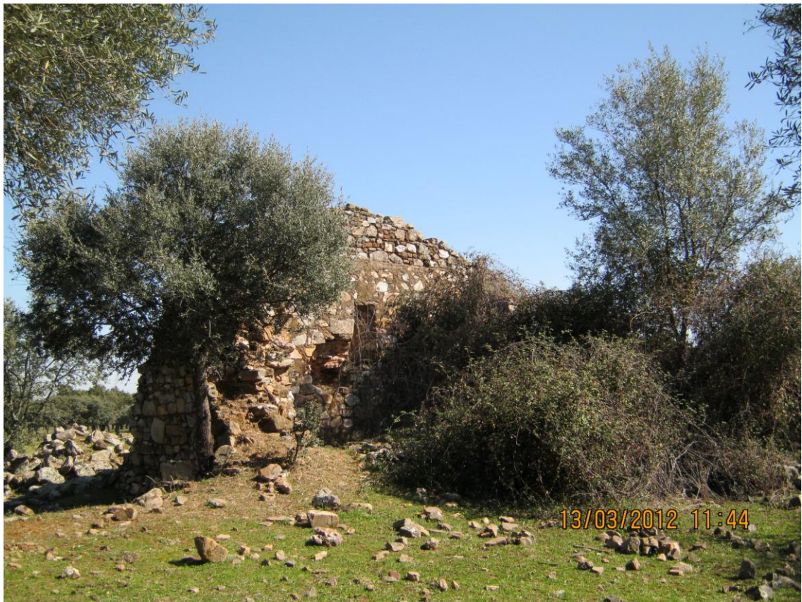
Ermita de Santa Ana