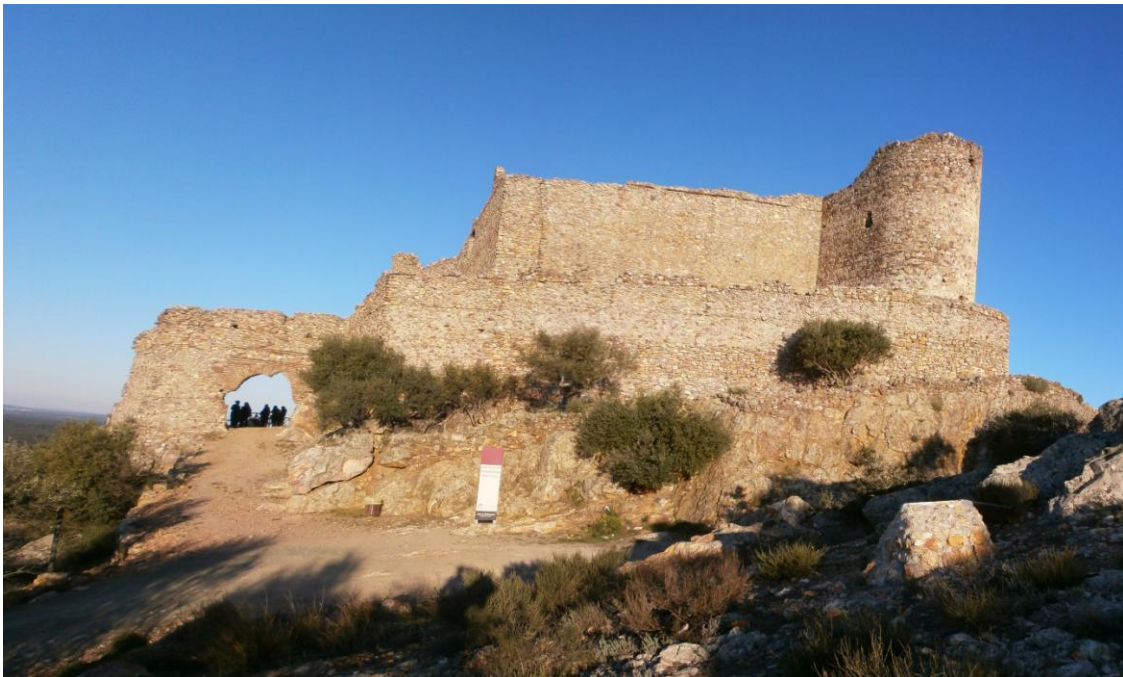
Castillo de Marmionda

Desde las proximidades de Portezuelo subimos al Castillo de Marmionda por una vereda de fuerte pendiente.