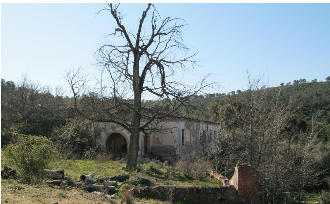
Casas en la proximidades el Molino del Tío Fabián

Junto al Molino también hay restos de algunas casas y una capilla.